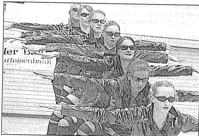
Bestens vorbereitet: Die „Musical Dance Company“ aus Kellinghusen machte in der Klasse der mindestens 28-Jährigen eine gute Figur.